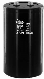
套管与标示颜色：黑色 / 金色